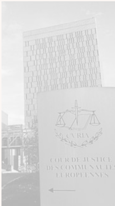
Sede del Tribunal de la UE en Luxemburgo.

Sin embargo, en lo que respecta a empresas y profesionales el escenario no está claro. Se abre la vía para que las empresas se ahorren esta cuota en muchos casos, pero no siempre. En principio, recae en las compañías la carga de la prueba de que no van a utilizar los equipos con fines que atenten contra los derechos de los autores. En este punto, las