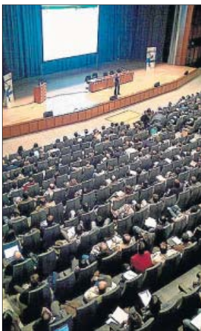
Más de mil webmasters se dan cita en Madrid desde hoy.