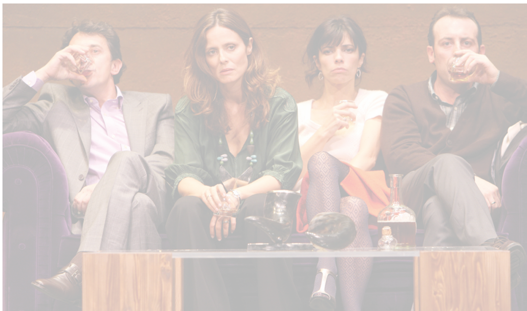
La actividad musical y de espectáculos mantiene al Euskalduna la cabeza de los auditorios estatales